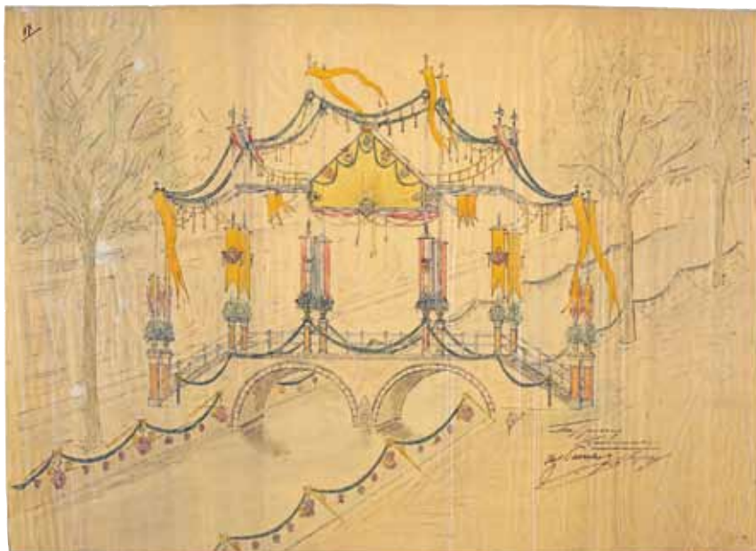
Tekening van de versiering van de Trapjesbrug op de Koornmarkt en de gracht er omheen.

Woensdag 14 september was er een uitdeling onder de armen van aardappelen, vlees en krentenbrood. Werknemers van de blikfabriek Lorrewa op de Koornmarkt