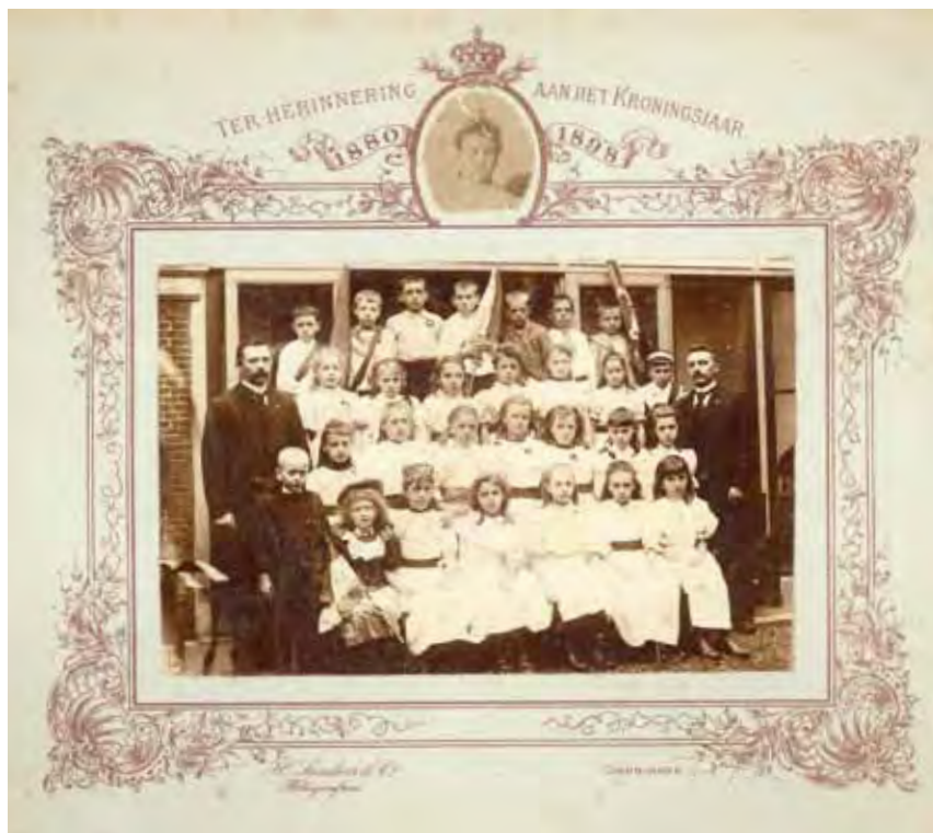
Klassenfoto van leerlingen van de J.Vermeerschool ter gelegenheid van de kroningsfeesten.

Alle landelijke kranten brachten verslag uit van de rellen in Delft. Ook de lezers van de Graafschap-bode lazen op 14 september: 'Men meldt ons uit Delft, dat daar Dinsdagavond op verschillende plaatsen weer ongeregelde heden hebben plaats gehad [...]. O.a. werden bij den boekbinder Van Dijk alle ruiten ingeworpen. Op de Voldersgracht voor het huis van den onderwijzer Ter Laan was de opgewondenheid van het volk zoo groot, dat de politie de gracht over een lengte van 100 meter moest afzetten. Zekere Dijkshoorn, die met een bijl gewapend de woning van dezen onderwijzer wilde stukslaan, werd door de politie in arrest gebracht. 't Is en blijft jammer dat zulke onverdraagzame handelingen een zoo schoon feest ontsieren.' 11 Zelfs De Volksvriend , een Nederlandstalig blad voor immigranten in Amerika, berichtte erover. 12 Merkwaardig genoeg is er in de Delftsche Courant van die dagen geen letter te vinden over deze gebeurtenissen die menig Delftenaar met eigen ogen gezien moet hebben. Wel plaatste de krant een kort berichtje dat er in Naaldwijk bij een plaatselijke socialist de ruiten waren ingegooid. Zo waren er op wel meer plaatsen in Nederland onlusten, maar nergens zo heftig als in Delft.