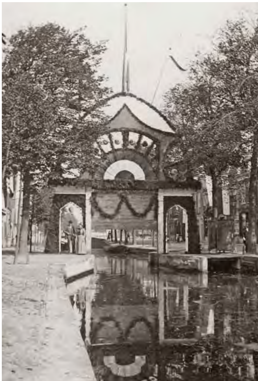
Ook de sluis in de Buitengewatersloot werd feestelijk versierd vanwege de feestelijkheden rond de inbulding van koningin Wilhelmina in 1898.